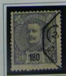
180 RS ARDÓSIA S/ ROSA