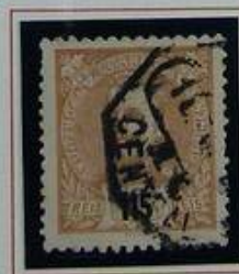
115 RS LARANJA S/ ROSA