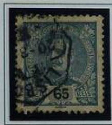
65 RS AZUL CINZENTO