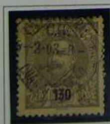
130 RS CASTANHO S/ AMARELO