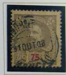
75 RS BISTRE S/ AMARELO