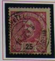
25 RS CARMIM