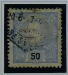
50 RS ULTRAMAR CLARO