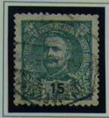
15 RS VERDE

IMPRESSÃO EM P. LISO, P. PONTINHADO EM LOSANGOS, E P. AMARELADO - DENT. 11½