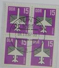
Flugpostmarken der DDR Erstausgabetag: 6. Oktober 1987 Entwurf: D. Glinski

Ein regulärer Messeflugverkehr zwischen der Bundesrepublik und der DDR wurde ab der Herbstmesse 1984 eingerichtet. Eine Boeing 737 der Lufthansa hatte bei ihrem Eröffnungsflug am 30.08.1984 in Frankfurt gestempelte Erstflugbelege nach Leipzig an Bord. Die