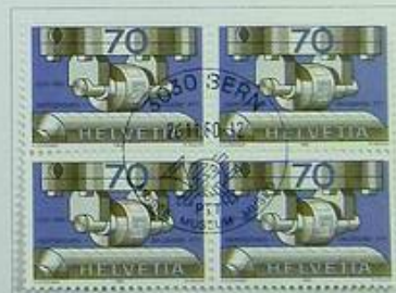
50 Jahre Wertzeichendruckeri PTT Cinquantenaire de l'imprimerie des timbres-poste des PTT Cinquantenario della stamperia dei segni di valore PTT