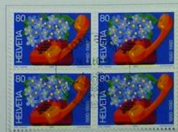
100 Jahre Telefon in der Schweiz Centenaire du téléphone en Suisse Centenario del telefono in Svizzera