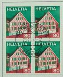
Ostschweiz Suisse orientale Svizzera orientale

LA DIREZIONE GENERALE DELLE PTT augura a tutte le collaboratrici e a tutti i collaboratori buon Natale e felice anno nuovo 3000 Berna, dicembre 1972