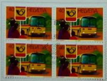
Schweizer Reisepost Postes suisses Service des voyageurs Poste svizzere Servizio viaggiatori