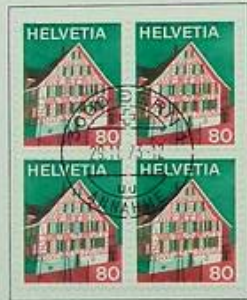
Ostschweiz Suisse orientale Svizzera orientale

LA DIREZIONE GENERALE DELLE PTT augura a tutte le collaboratrici e a tutti i collaboratori buon Natale e felice anno nuovo 3000 Berna, dicembre 1972