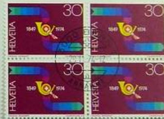
125 Jahre Eidgenössische Post 125 e anniversaire des postes fédérales 125 o anniversario delle poste federali