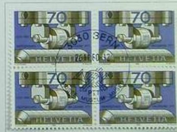
50 Jahre Wertzeichendruckeri PTT Cinquantenaire de l'imprimerie des timbres-poste des PTT Cinquantenario della stamperia dei segni di valore PTT