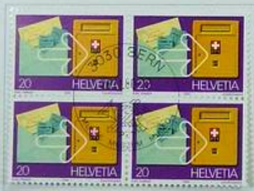
Postcheck Clèque postal Conto corrente postale