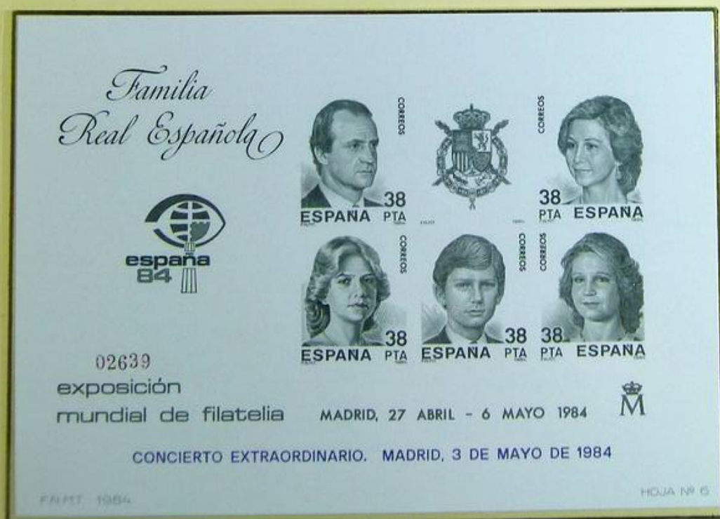
Hoja, recuerdo de la emisión anterior