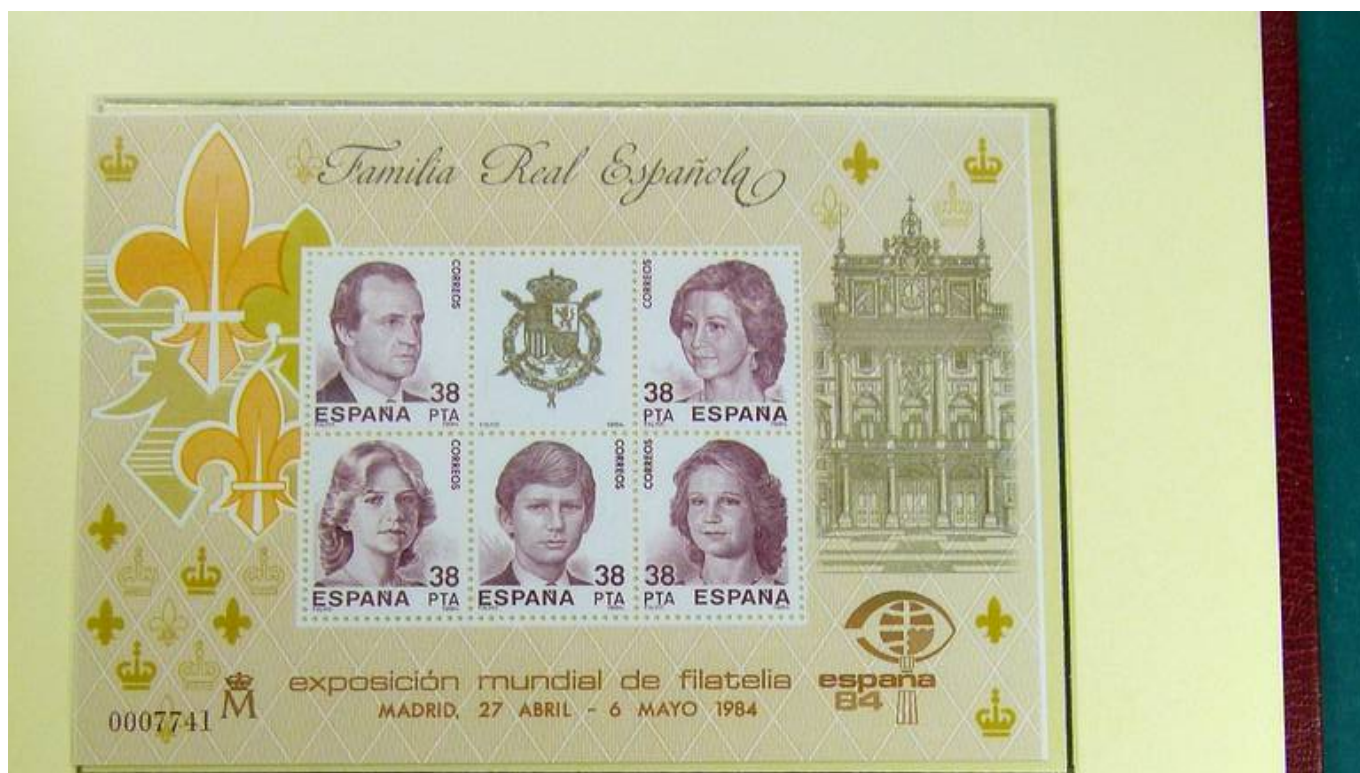
Hoja bloque, conmemorativa de la Exposición España 84