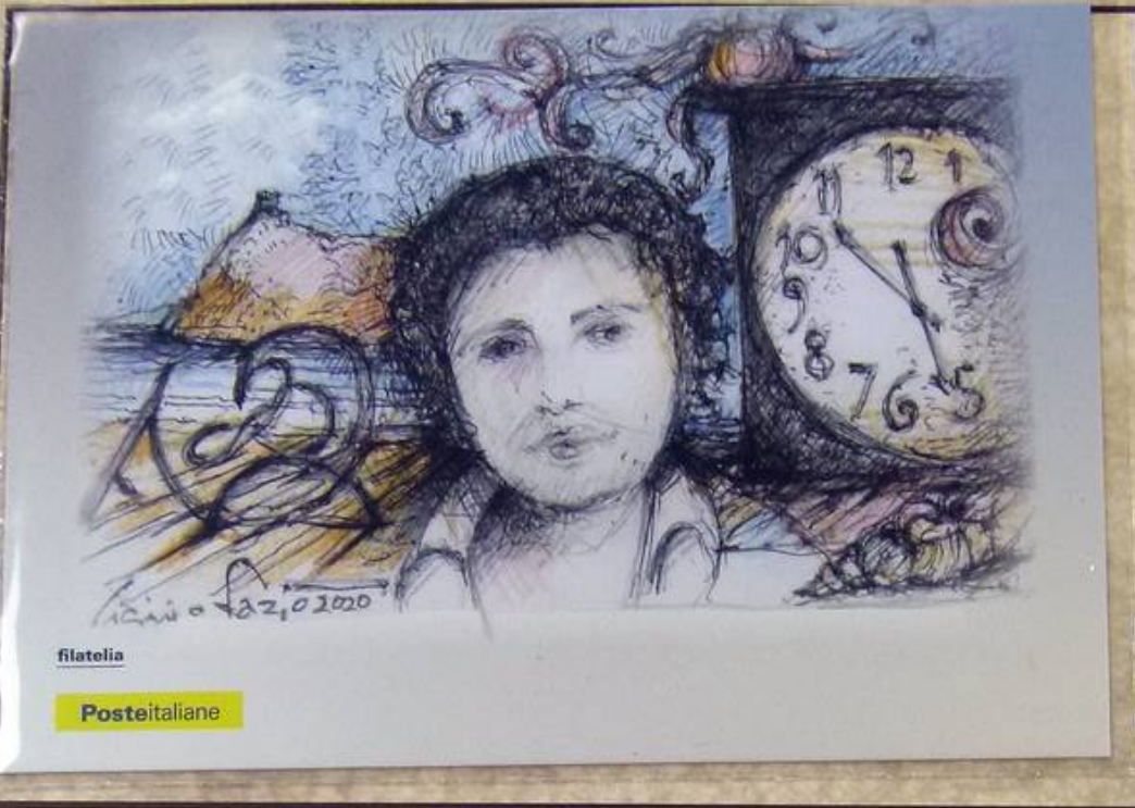
Illustrazione opera dell'artista Licinio Fazio

Le due cartoline vanno ad aggiungersi ad una collezione di cartoline filateliche che da 15 anni vengono realizzate per l'Associazione ed obliterate con il Bollo speciale figurato per commemorare Onofrio Zappalà e la strage di Bologna.